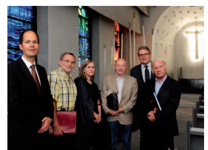
▲ Der Förderkreis der Mack-Kapelle mit Professor Heinz Mack (rechts im Bild).