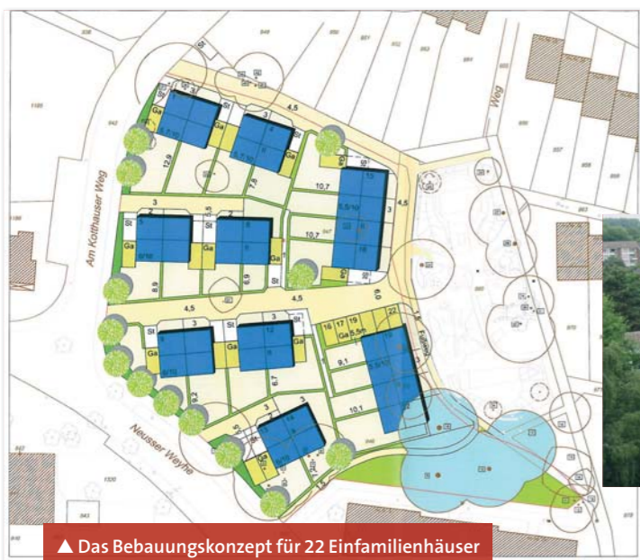
▲ Das Bebauungskonzept für 22 Einfamilienhäuser Am Kotthausweg 2-12.

Die Fassaden und Eingangsbereiche aller Häuser erhalten ein umfassendes "Lifting", die Garagenhöfe werden in zwei Bauabschnitten neu gestaltet und auch die Außenanlagen wird man künftig nicht wiedererkennen. Anstelle der bisherigen Grünflächen entstehen neue Aufenthaltsbereiche und Spielflächen. Teilweise werden auch regenerative, also erneuerbare Energien eingesetzt. Der Start ist bereits erfolgt. Das Ganze lässt sich die Neusser Bauverein AG rund drei Millionen Euro kosten.