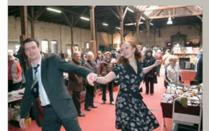
▲ Stöbern, feilschen, genießen: Der „Gare du Neuss“ ist ein Trödelmarkt mit Erlebnischarakter, wo auch schon mal Kleinkunst-Darbietungen zu bewundern sind.